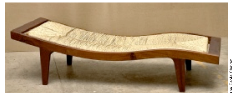
► Un asiento curvilíneo tapizado en palma da vida a una tumbona.