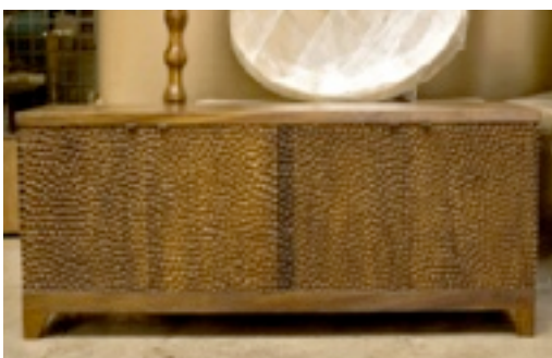
► Una cómoda con madera tallada destaca en sus propuestas.