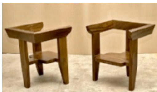
► Las piezas se distinguen por su estilo rústico y vanguardista.

Una silla partera de madera fue el punto de referencia para centrar la atención de este diseñador hacia el giro mobiliario