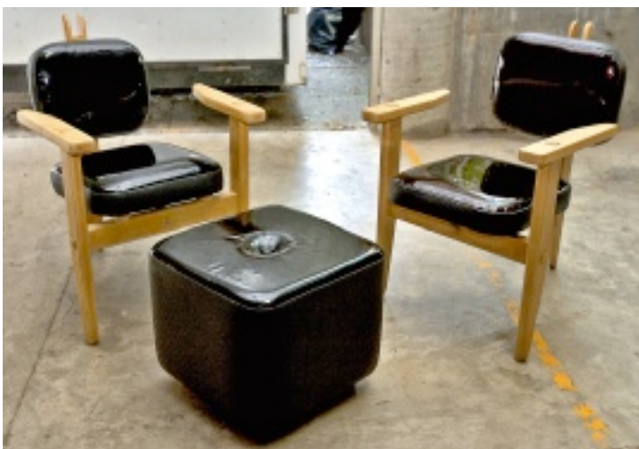
► El charol negro es un material recurrente en sus diseños.